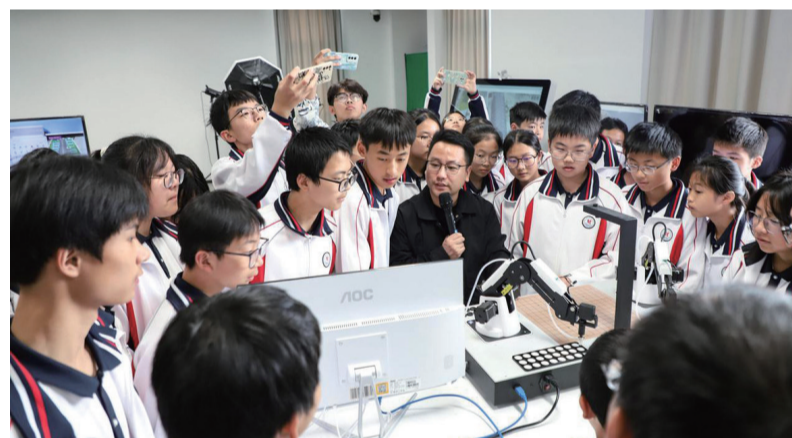
缙云县湖川初级中学学生在丽水学院参加“大手拉小手 浙丽绘同心”大中小学思政教育一体化建设活动。