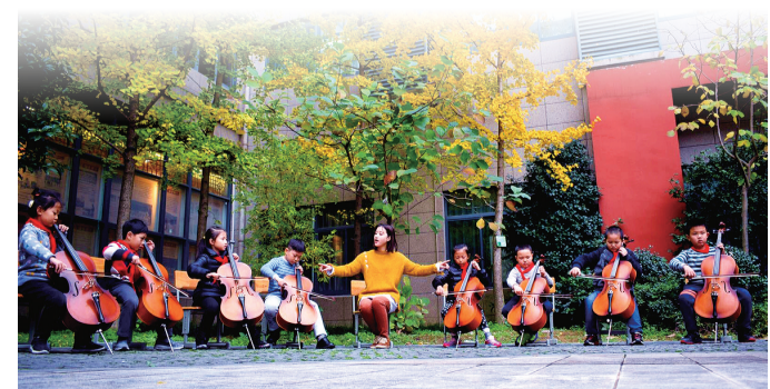
宁波市江北区大力推进特色办学,实施“一校一品”“一生一技”等机制。图为江北区中心小学学生在练琴。