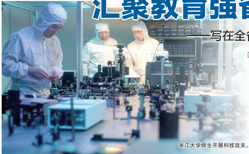
浙江大学生开展科技攻关。

同样是在一个春天。 2019年3月,全省教育大会召开。“要深入学习贯彻习近平总书记关于教育的重要论述和全国教育大会精神,优先推进教育高质量发展,率先高水平实现教育现代化”,会议上,字字铿锵,声声入耳。 6年的时光里,浙江教育这份答卷变得更加厚重。翻阅它—— 起笔是“中国式现代化教育示范省建设”;