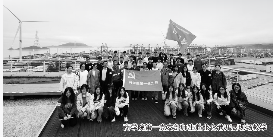
商学院第一党支部师生赴北仑港开展现场教学

要求每位教师将思政育人理念融入专业课堂，商学院扎实推进课程思政改革，第一党支部每学期都会开展课程思政“学、评、议、辨”教研活动，将课程思政作为党建引领育人的主战场。党员教师不仅积极申报各级别课程思政示范课、研究课题、主题微课，还会把学生带往港口、企业、展览馆等，上好行走的红色专业课。