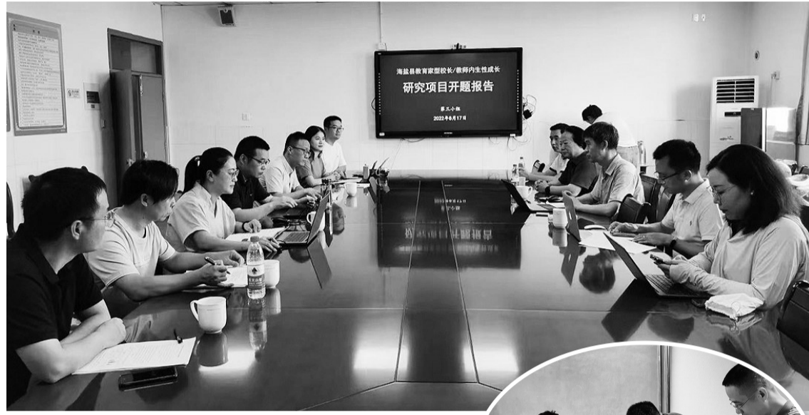
学员研究项目开题报告