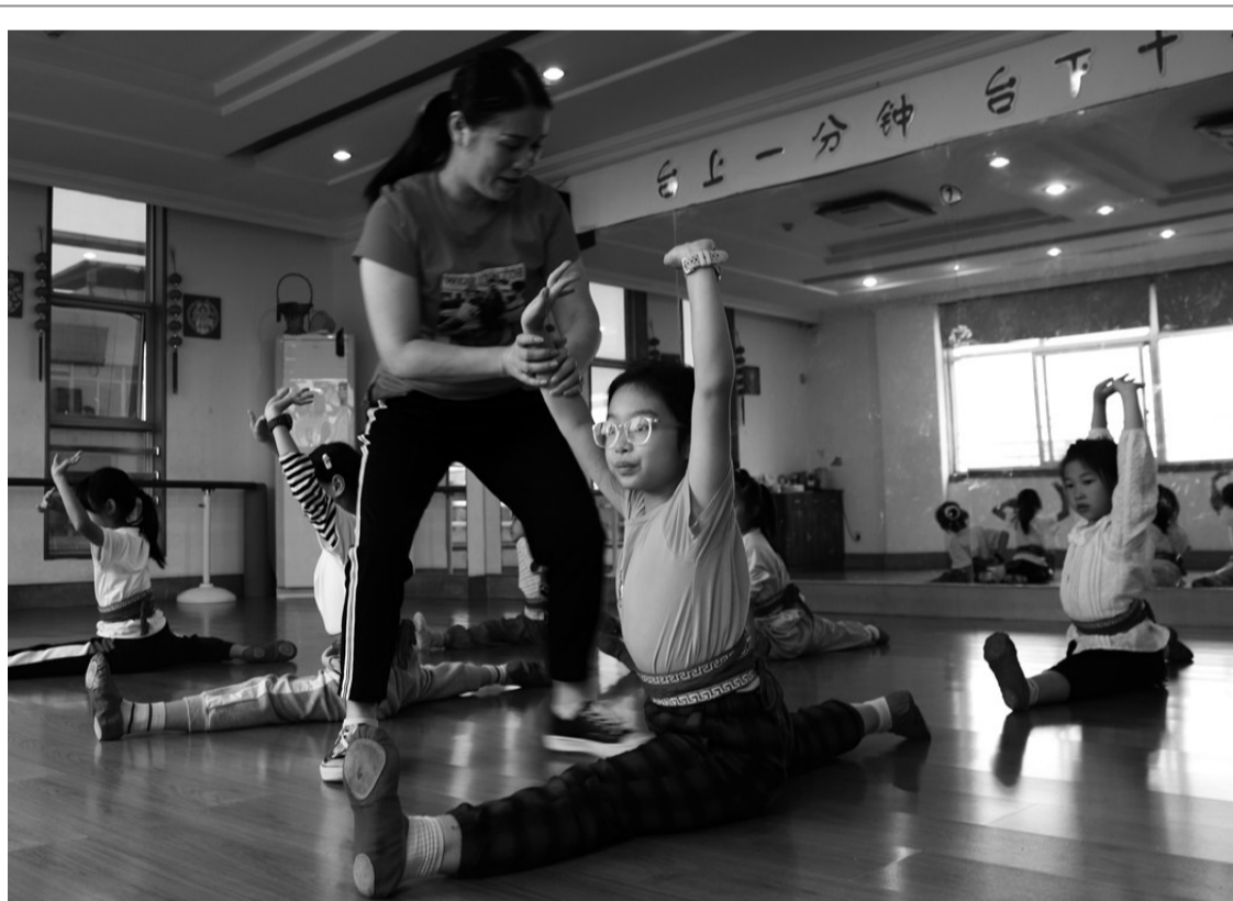
嵊州市一直注重越剧传承,每年在中小学校、幼儿园和机关机构学唱越剧的学生超一万人次。到2023年8月底,该市拥有59朵“小梅花”(中国少儿戏曲最高荣誉“小梅花奖”获得者)。图为鹿山小学学生在越剧传承人的指导下苦练基本功。