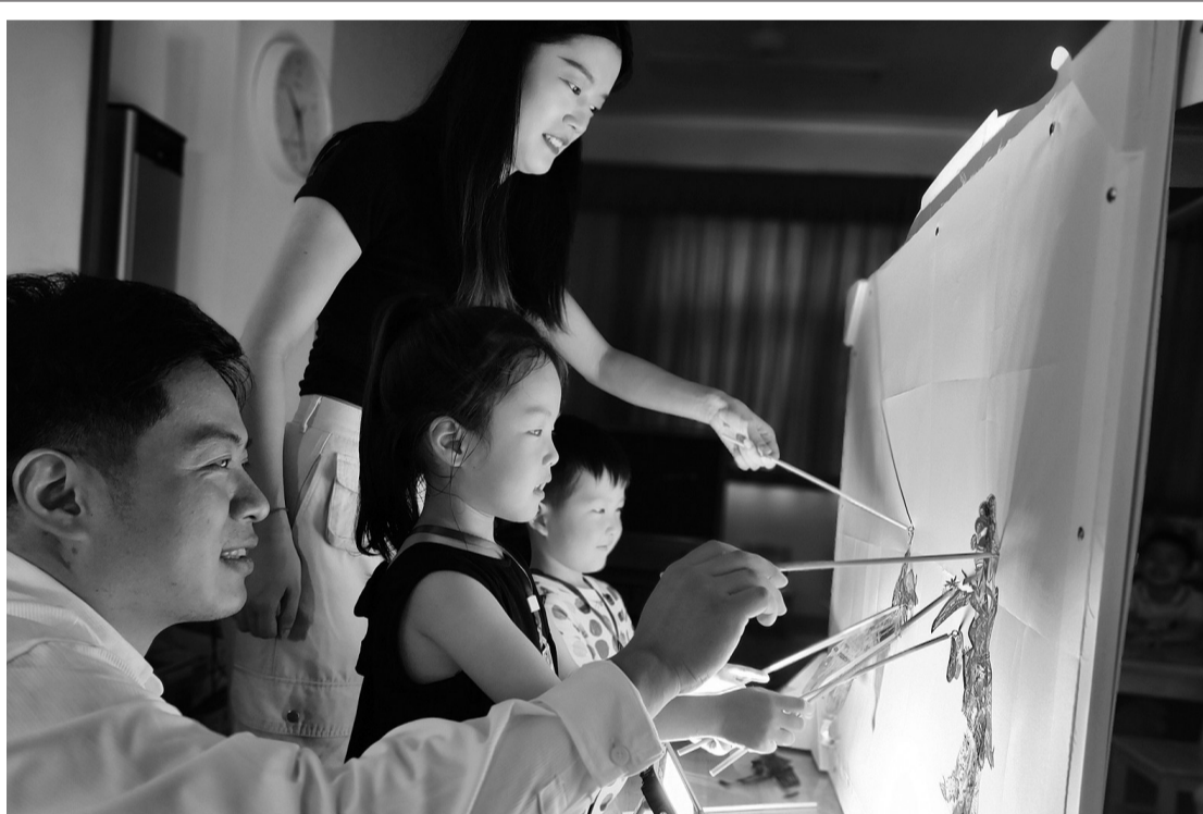
近日,湖州开发区实验幼儿园开展了“探‘影’戏剧,享‘玩’乐趣”主题活动。幼儿们在家长志愿者的带领下,了解皮影戏的起源和制作,被皮影戏中生动的人物形象和故事情节深深吸引。在欢快的音乐中,“孙悟空大闹天宫”引得台下掌声不断。接着,幼儿们迫不及待地挑选自己喜欢的皮影人偶参与表演,充分感受非物质文化遗产的魅力。