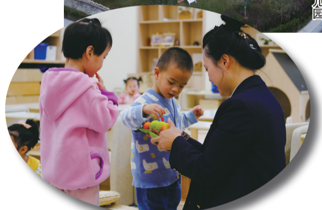
托班教室里,教师和孩子们正在进行游戏互动