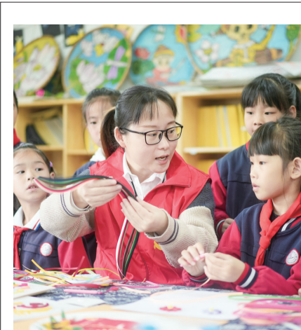
日前,长兴县吕山乡中心小学邀请当地盘纸艺人走进校园,手把手教学生制作爱国爱党主题的盘纸作品,以特殊形式学习宣传党的二十大精神。

专业紧贴产业创新。职业教育专业建设要“应需而变”,精准对接产业需求,动态调整、实时优化,实现与产业发展同频共振。一方面,聚焦浙江区域经济社会发展新特点,重点设置与数字安防、网络通信、智能计算、生物医药等浙江标志性产业相关的专业,减少或取消设置限制类、淘汰类产业相关专业。另一方面,围绕推动浙江区域产业转型升级,注重制造业、纺织服装业等浙江传统产业相关专业的改革和建设,服务传统产业向高端化、低碳化、智能化发展。(下转第2版)