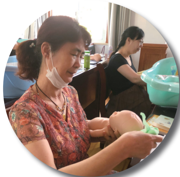
图为当地社区居民在学习育婴技能。

为。”陈海波表示,近年来,围绕“四个舟山”建设目标,社区教育积极融入群岛新区建设,形成了鲜明的海岛特色,各县(区)把社区教育培训与本地的产业结构发展相结合,坚持“实际、实效、实用”的原则,走出了“一地一品”的特色发展之路。普陀区朱家尖成校立足旅游开展海岛旅游服务培训,六横成校做精做大临港工业技能培训,岱山县长涂成校开展大型船企职工培训等,都与当地的经济产业发展实现了无缝对接。