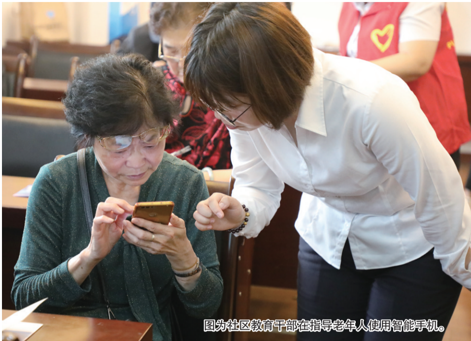
图为社区教育干部在指导老年人使用智能手机。